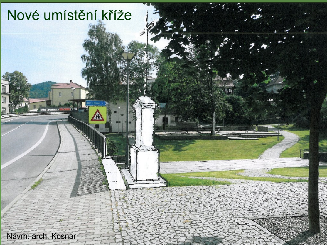
Nové umístění kříže