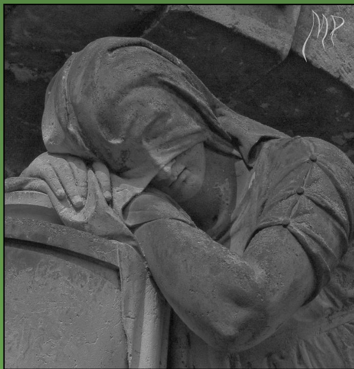
Truchlící žena, autor neznámý, kolem roku 1870